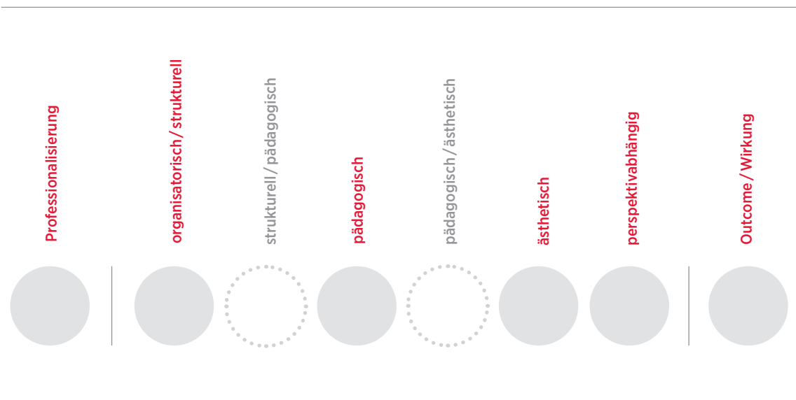
Schema zur Gruppierung der Qualitätsmerkmale